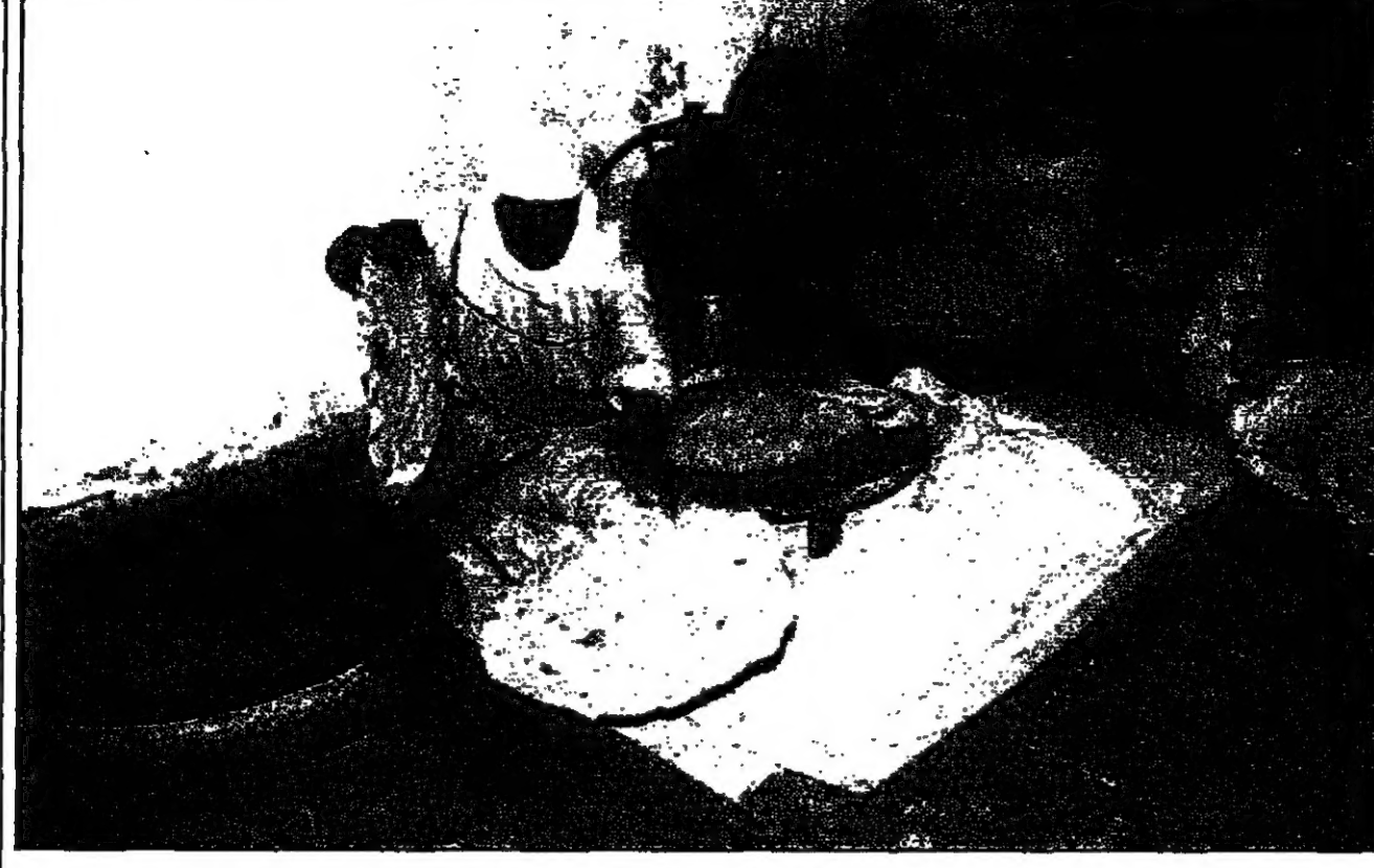
لم عراقية وإطلاقها في انتظار الحجز (رويترز)

تلما لم يخضع هذا البلد للتحشيش من الأسلحة من جانب الأمم المتحدة... واشنطن تسعى لسحب 10 من رعاياها تمهيدا لضرب بغداد